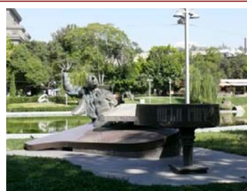
Arno Babajanian – Parc de l'Opera Photothèque Saberateurs