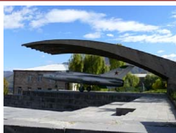
Musée des frères Mikoïans

Départ à Alaverdi. Visite du pont et du monastère de Sanahin , la maison-musée des frères Mikoïan : Anastase, le politicien et Artém, l'ingénieur aéronautique et créateur de l'avion de chasse MIG.