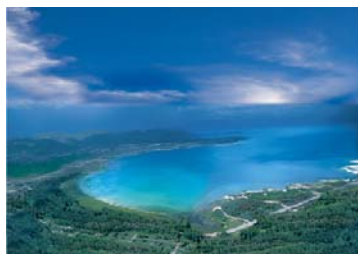
Lac Sevan Yann-Arthus Bertrand

Départ à Erevan. Visite de Sevanavank , de Hayravank et de Noratous : le plus vaste cimetière de l'Arménie abritant des khatchkars (croix de pierre).