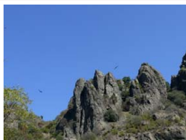
Falaise de Tamerlan Photothèque Saberateurs

Départ à Akhtala. Visite du monastère d'Akhtala , un rare témoin de la présence du chalcédonisme arménien au nord de l'Arménie célèbre pour ses remarquables fresques du XIII e siècle, ses chapelles et la falaise de Tamerlan « Lenktimur » .